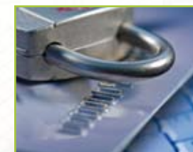
Bank / Försäkring / Säkerhet