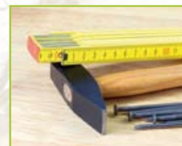
Bygg / Verktyg / VVS