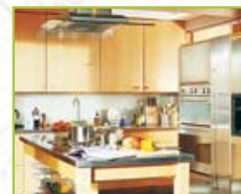
Kök / Badrum / Förvaring