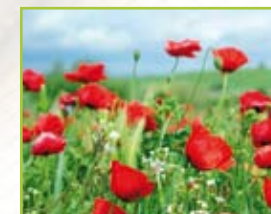
Trädgård / Uterum