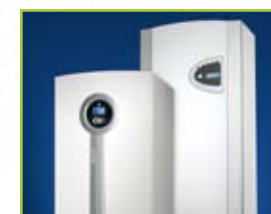
Energi / Värme